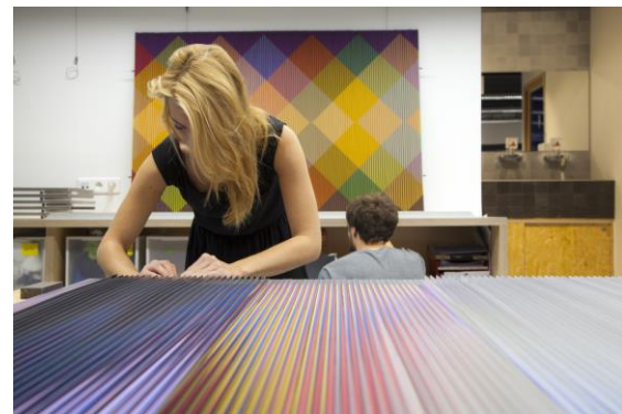
telier Cruz-Diez, Paris, 2018

miembros de la familia, estamos ayudando. Somos conscientes de que tenemos una posición privilegiada para hacerlo. Es cierto que con el paso del tiempo ambos estudios, en Panamá y también en París, se han abierto a otros artistas. Se iniciaron nuevas colaboraciones. De este modo, los estudios pueden acompañar a los nuevos artistas en su camino y no sólo reproducir las creaciones del Maestro. Como fundación, por supuesto, estamos interesados principalmente en hacer que el arte sea accesible al público, lo que considero sobre todo una tarea educativa.