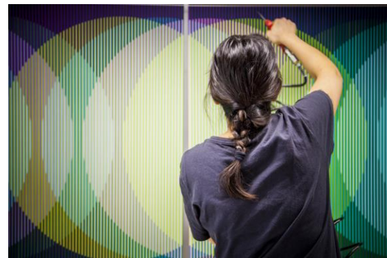
Atelier Cruz-Diez, Paris, 2018

muy a menudo sobre los proyectos y exposiciones de mi padre, así como sobre su teoría de los colores. Después de la escuela y especialmente durante las vacaciones se nos permitió ayudarlo con su trabajo desde el principio, un trabajo que requería mucho tiempo, paciencia y un trabajo meticuloso con los dedos.